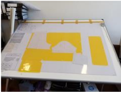
Digitalizační tabule s kurzorem s lupou

Během své praxe jsem si vyzkoušela práci s Cutterem, ruční pilou, nakládala jsem látky a vyzkoušela jsem si pracovat v programu Acumark pro polohování stříhů pro cutter.