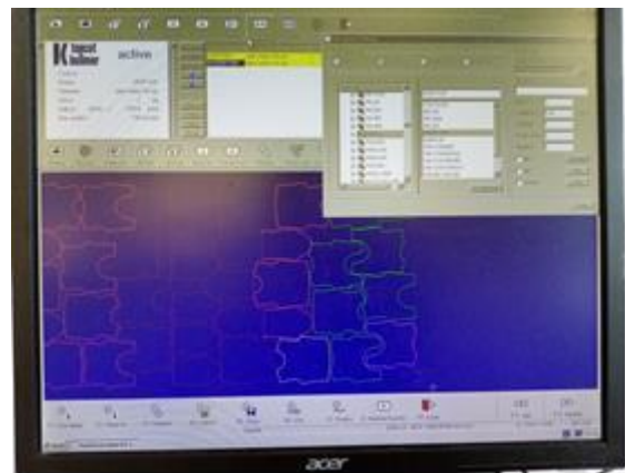
Obrazovka s vybranou polohou

Během praxe jsem si vyzkoušela, jak se ovládá a seřizuje Cutter a ruční pila. Vyzkoušela jsem si i navrhovat polohy stříhů pro Cutter. Zkušenosti, které jsem v této firmě získala, mohu využít u státních zkoušek, jelikož jeden okruh se týká právě Cutteru.